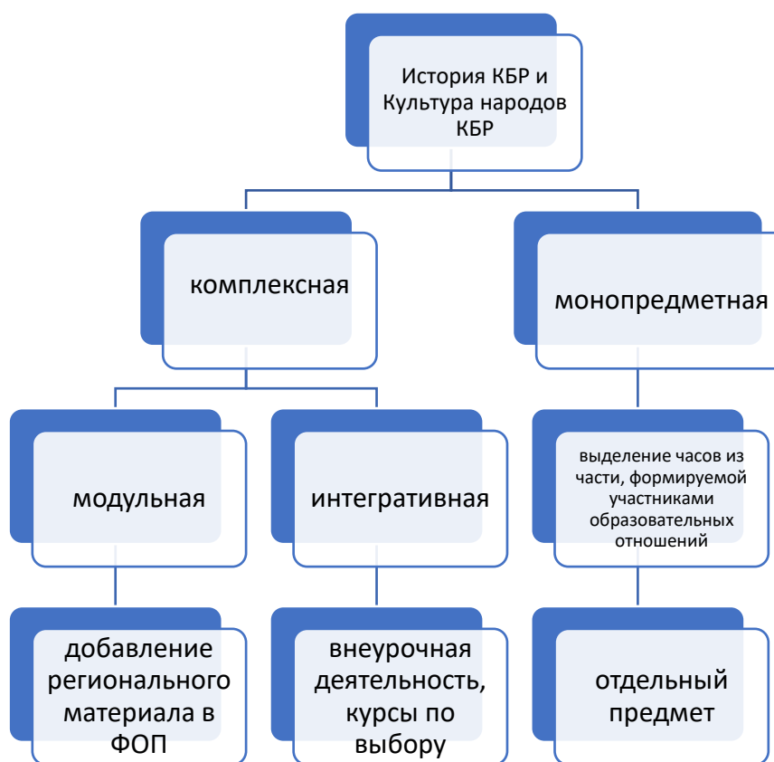
Рис. 1. Модель реализации региональной истории в учебном процессе общего образования Кабардино-Балкарской Республики

регионального исторического образования в монопредметной и комплексной вариациях (Рис. 1).